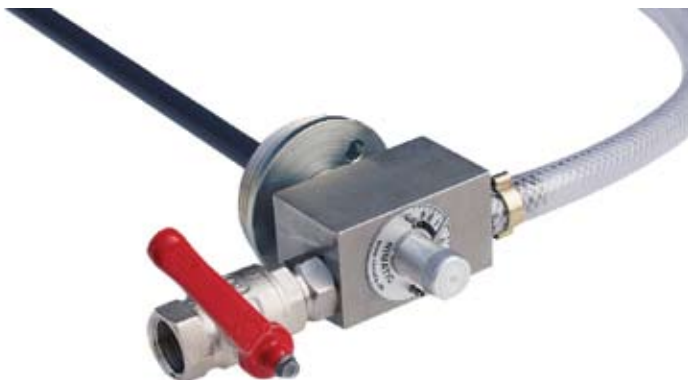
Nimatic emulzióbekeverő egység

folyamat része, amelyet mi magunk okozunk. Az emulzióba bekerülő idegen szennyeződés (olaj) membránként elfedi az emulziót és megakadályozza az oxigénellátást. Amennyiben ez a folyamat huzamosabb ideig tart, úgy egyértelműen okozhatja az emulzió idő előtti zétesését, amelyet emulzió töltetcsere követ. Rendszertisztítás, gépleállítás,