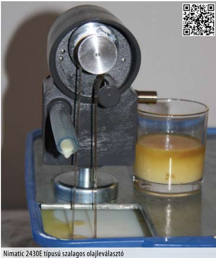
Nimatic 2430E típusú szalagos olajleválasztó